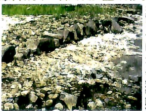
4! 坂本城の石垣(湖中)